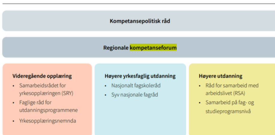
Figur 5-13. Arenaer for samarbeid med arbeidslivet